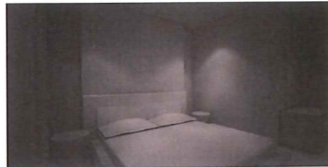
Progetto per un appartamento in Via Caduti di Nassirya 187